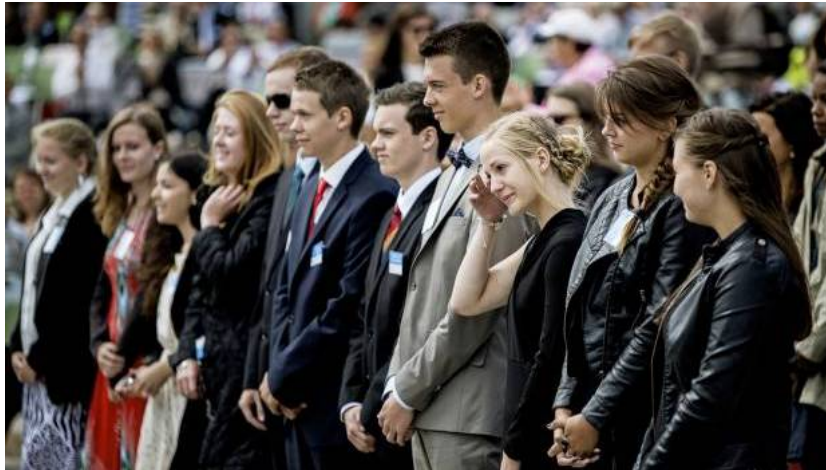
TRO. Ved Jehovas Vidners træf Silkeborg i denne måned bliver medlemmerne opfordret til at undgå »frafaldne, uddannelse og uafhængig tankegang«.

Politikere har berøringsangst over for grupper, der kalder sig religiøse, mener stor hjælpeorganisation.